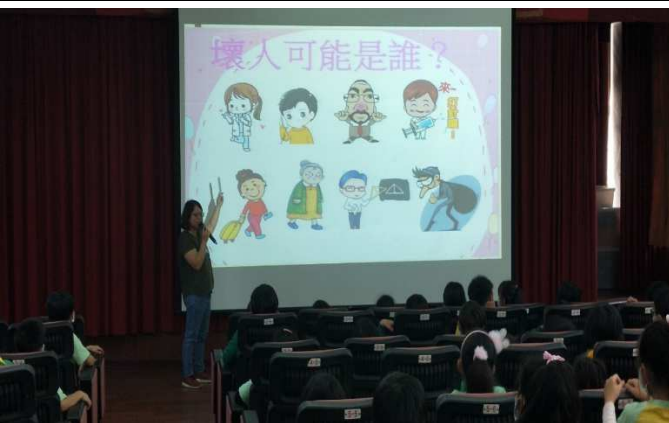
說明：讓學生思考加害者可能是誰