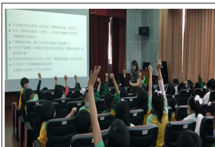
說明：學生舉手有獎徵答