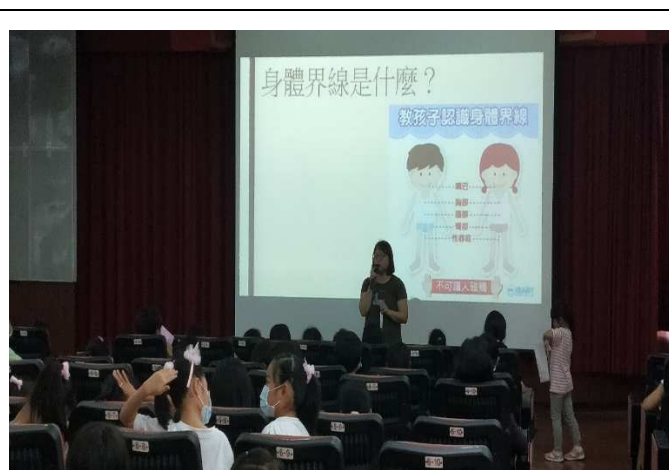
說明：說明身體界線