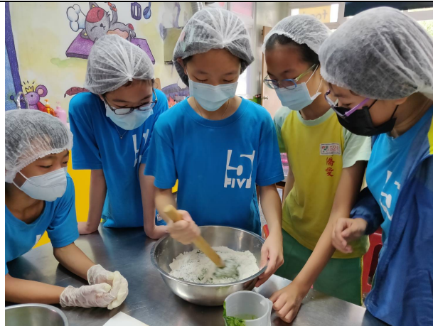
說明：中筋麵粉拌入蔬菜液及食鹽，攪拌。