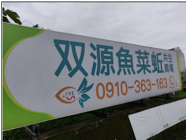
說明：「双源魚菜坵共生農場」體驗活動。