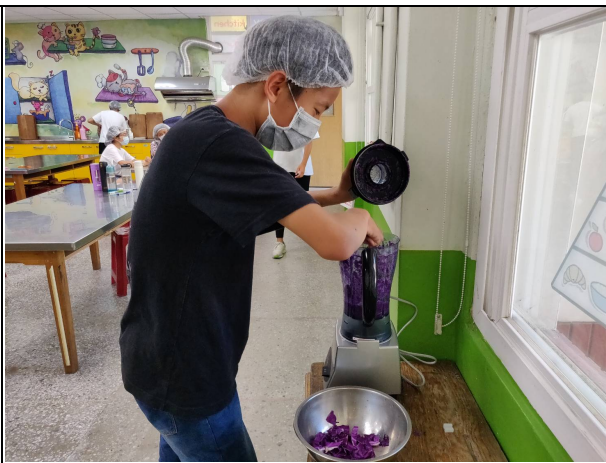
說明：蔬菜清洗後利用果汁機打成泥。