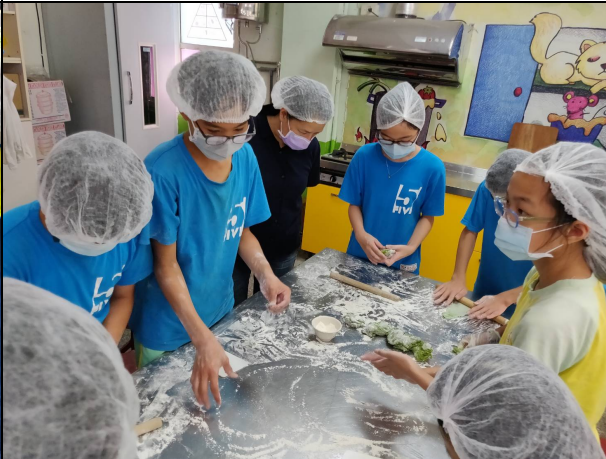
說明：麵糰揉至三光。