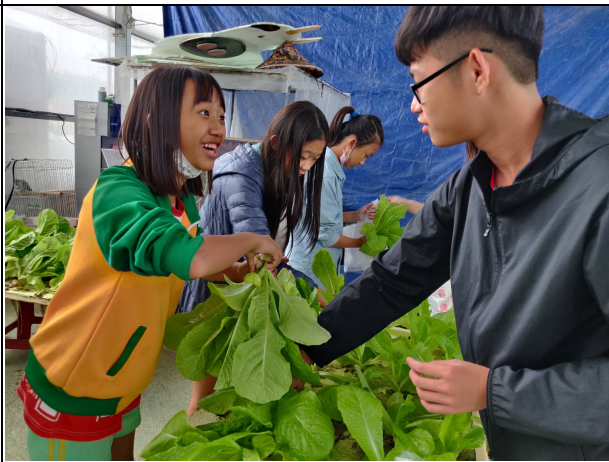
說明：水耕蔬菜採收體驗。