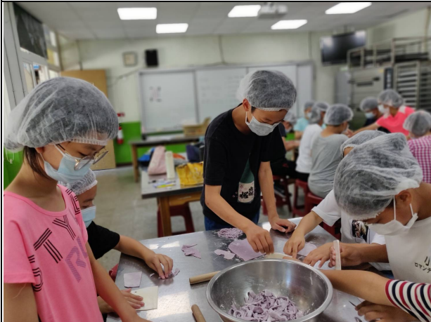
說明：麵糰擀平切割製麵。