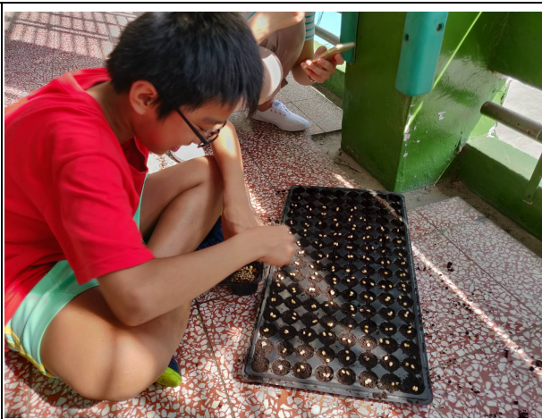
說明：小麥種子育苗。