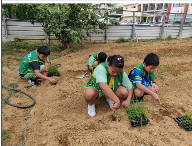
說明：小麥苗種植於開心農場中。