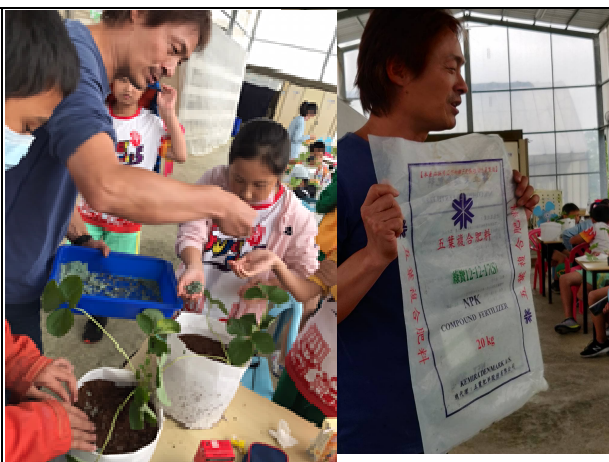
說明：阿貝教導學生草莓種植技巧與所需肥料介紹。