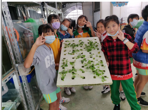
說明：各組完成水耕生菜種植。