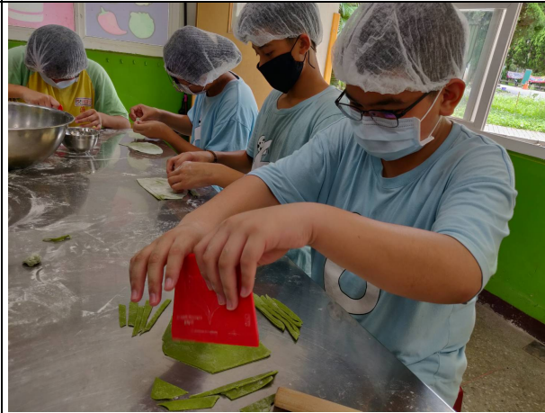
說明：麵糰擀平切割製麵。