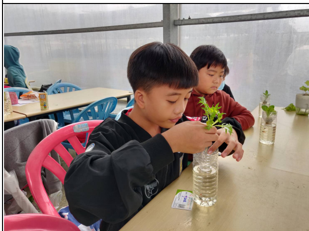
說明：簡易魚菜共生製作-快樂瓶。