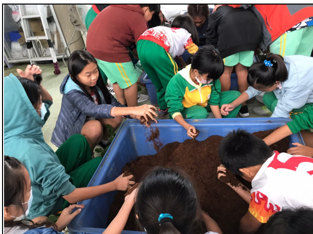
說明：草莓種植-椰纖與優質土 2:1 混合。