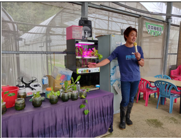
說明：農場阿貝進行魚菜共生解說。