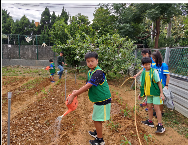
說明：澆水，期待小麥長大、長高！