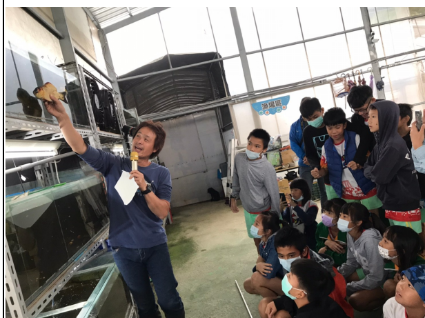
說明：認識適合魚菜共生的魚種，鱸魚、鱒龍魚、台灣鯛等。