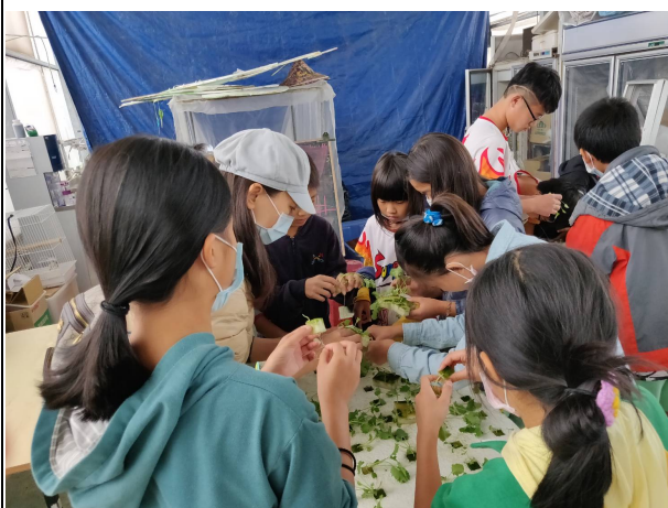
說明：水耕生菜種植體驗。