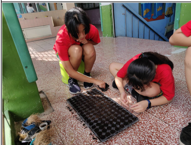
說明：小麥種子育苗。