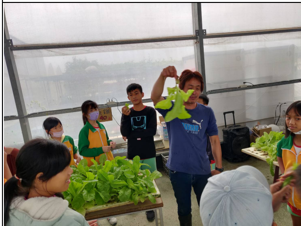
說明：水耕蔬菜採收說明。