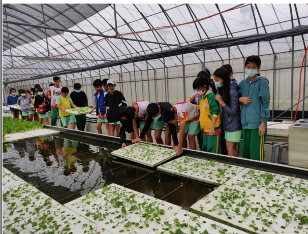
說明：種植完成的苗，小心放入水池中。