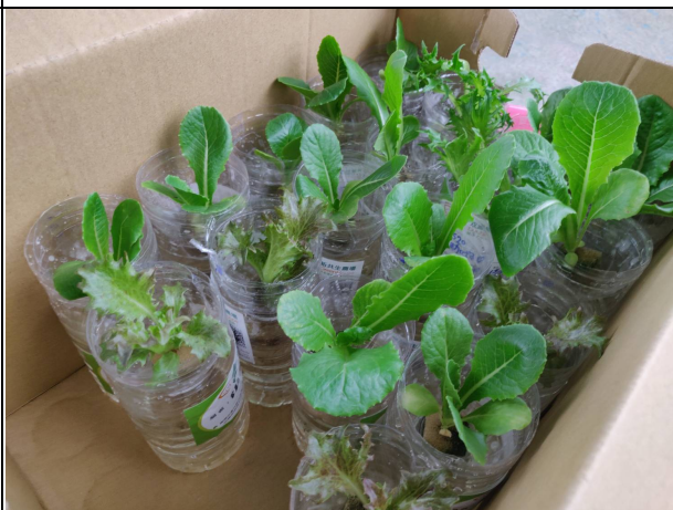
說明：快樂瓶大集合。