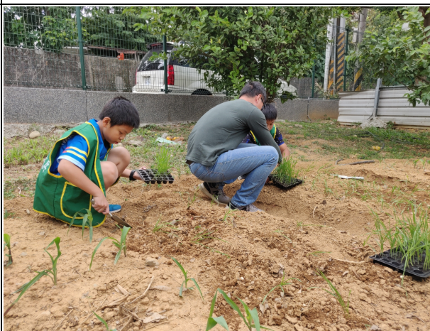
說明：主任教導學生將育好的小麥苗種植於開心農場中。