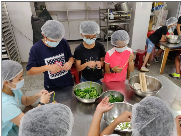
說明：彩色麵條之變色食材處理-地瓜葉、紅蘿蔔、紫高麗菜清洗處理。